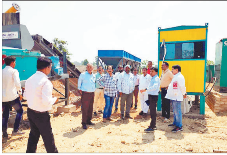
डेकेदार के प्लांट में निरीक्षण करते सीई व अन्य अधिकारी।