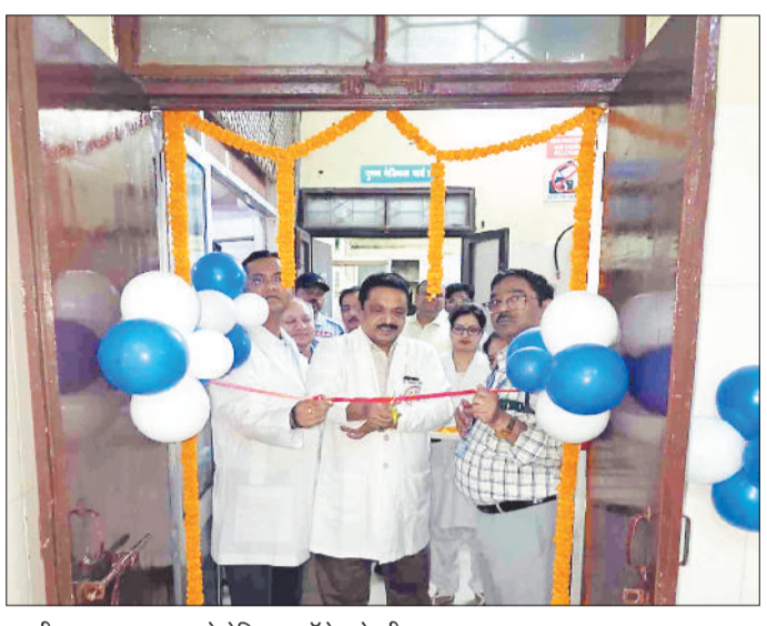
एचडीयू का उद्घाटन करते मेडिकल कॉलेज के डीन।