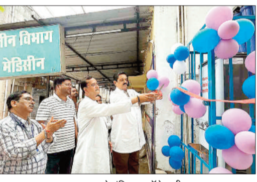
वाटर कूलर का उद्घाटन करते मेडिकल कॉलेज डीन व अन्य।

भीषण गर्मी को ध्यान में रखकर अनोखी सोच संस्था के पदाधिकारियों ने मेडिकल कॉलेज अस्पताल परिसर आपात कालीन केन्द्र के सामने मरीज व परिजन के सुविधा के लिए वाटर कूलर उपलब्ध कराया। वाटर कूलर का आज मेडिकल कॉलेज डीन व अस्पताल अधीक्षक ने उद्घाटन किया। आपात कालीन केन्द्र के सामने शुद्ध पेयजल की सुविधा उपलब्ध हो जाने से अब लोगों को काफी राहत मिलेगी।